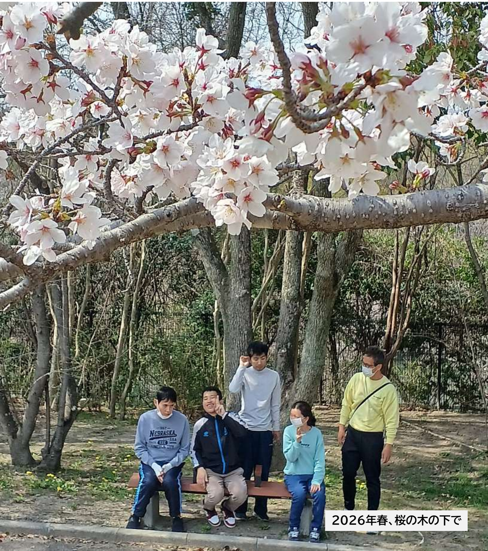
2026年春、桜の木の下で