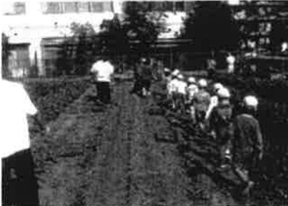
さつまいも収穫 <あかつき園・ワークセンター>