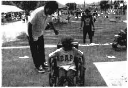
西南ジャンボリー