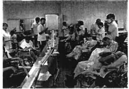
流しそうめん <ささゆり園>