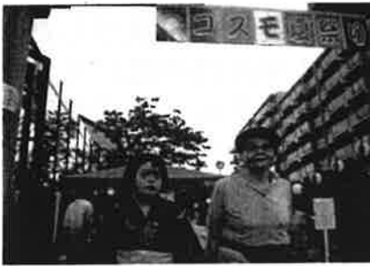
夏祭り <グループホーム>