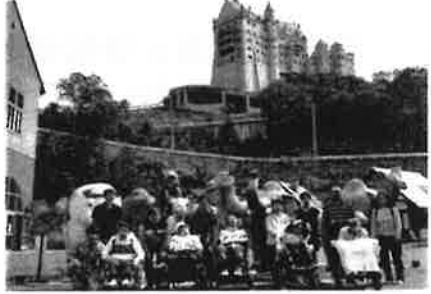
宿泊旅行 <ささゆり園>