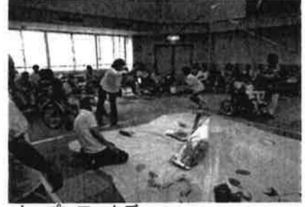
オープンワークデー <あかつき園・ワークセンター>