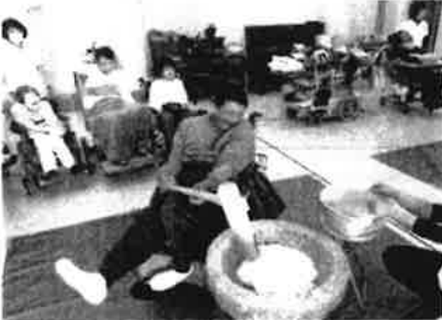
もちつき大会 <ささゆり園>