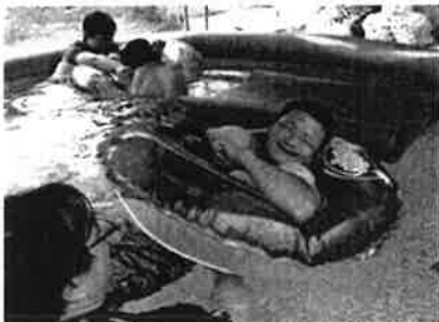
プール活動 <ささゆり園>