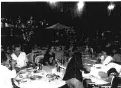
ビアガーデン <ささゆり園>