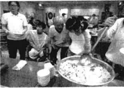
鍋パーティ <あかつき園・ワークセンター>