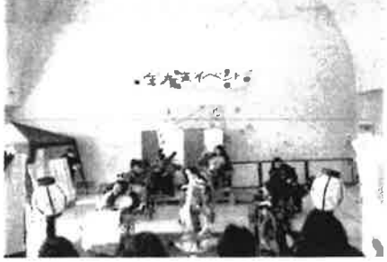
年度末イベント <ささゆり園>