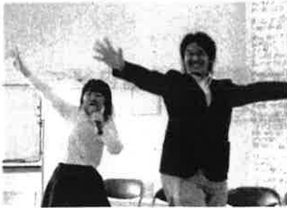
コンサート <ささゆり園>