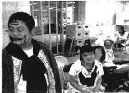
肝試し <あかつき園・ワークセンター>