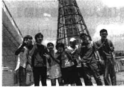
所外活動 <あかつき園・ワークセンター>